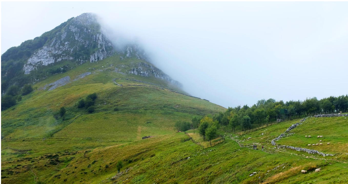
Hernio, lainopear, Zelatuneko lepotik.

https://urolaturismoa.eus/wp-content/uploads/2021/06/Hernio-EUS-CAS.pdf